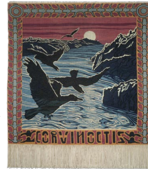
Walter Leistikow, Bildteppich „Corvi Noctis“ (Nachtraben) um 1898, Wolle auf Leinenkette, gewebt

Born on 25 October 1865 in Bromberg (now Bydgoszcz in Poland), Leistikow moved to Berlin in 1883 and attended the Prussian Academy of Fine Arts, albeit for a mere six months. The main subject of Leistikow's paintings was his native countryside, the beautiful lakes and pine forests of the Mark Brandenburg. Preferring a stylised and abstract form of painting, Walter Leistikow was one of the principal forerunners of modern art in Germany, most notably in Berlin. A champion of the Modernist cause, he joined Max Liebermann in founding and leading the XI Group in 1892, a group of artists who opposed the stringently controlled exhibition policy of the Prussian Academy of Fine Arts. Periods abroad in Paris and Scandinavia introduced Leistikow to different currents in contemporary art, encounters which inspired and enriched his work. Meanwhile, his