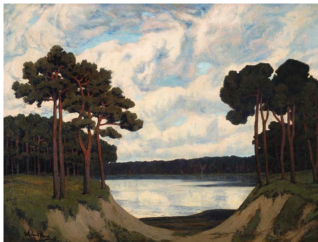
Walter Leistikow, Blick auf die Havel, 1900-1905, Öl auf Leinwand

Mit Stimmungslandschaften – Gemälde von Walter Leistikow präsentiert das Bröhan-Museum eine Ausstellung, die das Werk eines der wichtigsten Künstler der Berliner Secession in all seinen Facetten beleuchtet. Die Ausstellung, die anlässlich von Leistikows 100. Todestag im Jahr 2008 eigens konzipiert wurde, zeigt anhand von über 90 Exponaten sein vielfältiges künstlerisches und kulturpolitisches Wirken. Ausgangspunkt ist der hochrangige Bestand des Bröhan-Museums an Werken Walter Leistikows. Die Leihgaben – Gemälde, Grafik sowie Kunsthandwerk – stammen aus bedeutenden internationalen und nationalen Museen und Privatsammlungen.