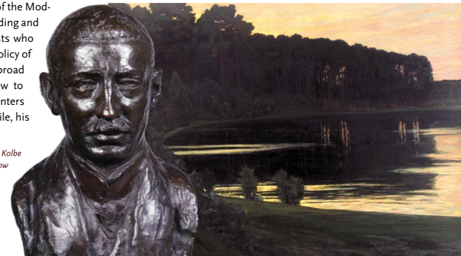
Georg Kolbe Porträt Walter Leistikow 1907, Bronze © Staatliche Museen zu Berlin, Nationalgalerie © VG Bild-Kunst, Bonn 2008 Foto: Andres Kilger