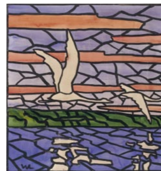
Walter Leistikow Ziehende Schwäne, Entwurf für ein Glasfenster in Mosaikverglasung 1898/99, Gouache

Wie zahlreiche Maler der Generation um 1900 zeigte Leistikow auch Interesse für andere Gebiete der Kunst. Neben seinem malerischen Werk entstand ein grafisches Œuvre. Die Tendenz zu Flüchtigkeit und Vereinfachung der Form ließ ihn darüber hinaus prädestiniert erscheinen für den Entwurf von modernen Bildteppichen, eine Kunstform, die sich in der Raumkunst um 1900 besonderer Wertschätzung erfreute. Das ganze Spektrum der künstlerischen Äußerungen Leistikows ist in der Ausstellung im Bröhan-Museum zu sehen.